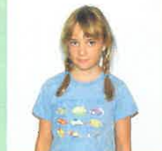
Helena 8 let žebřiky