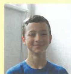
Jan 13 let UV