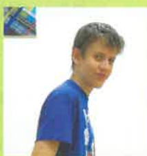
Martin 13 let rola