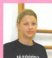
Kačka 13 let rola